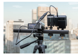
◀ビデオカメラにPressITとUSB給電機器をつないだ様子