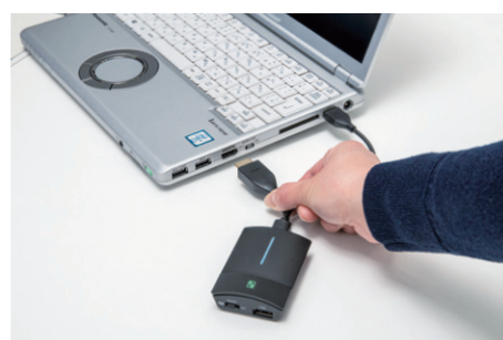
▲PCのHDMI端子に挿すだけで簡単に使用可能。USBは給電用に使用