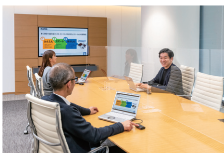
▲ワイヤレスなので自由な席に座って打ち合わせが可能