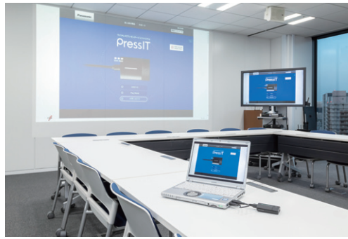
▲ハイブリッドセミナーに対応した大会議室

PressITは最大4画面までの分割表示が可能のため、複数名が発表する打ち合わせで活躍しています。特に経営企画部門の会議では、資料はもちろん、その場でWEB検索して情報を出し合いながら議論することが多く、PressITにより様々な資料や映像を会話と同時に共有できるようになったことで以前より活発なプレスト会議が可能になりました。また方針発表会などでは、これまではプロジェクターのケーブルの長さ制限がありスライド表示を担当する社員が会場の前方に席を構えなければなりませんでした。後方の目立たない位置から遠隔で操作できるようになりました。