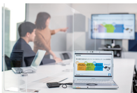
▲PCにPressITをつないだ様子。ケーブルが届かなかった場所からも画面共有が可能に

PressITは挿すだけですぐに使用できることが導入の決め手となりました。特に、USBを給電のみに使用し、表示コンテンツはHDMIで転送するため、セキュリティポリシーによりUSB端子の使用が制限されている部門でも安心して使える点は高く評価されました。また、ドライバーをインストールする必要もないため、来客時にはお客様のPCからも簡単に画面を共有することができます。さらに、PCだけでなくビデオカメラにもつなぐことができ、撮影映像のワイヤレス転送がシンプルかつ簡単になる点も採用のポイントとなりました。