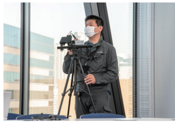
◀以前はケーブルが届くところまでしか移動できなかったがワイヤレスになり撮影時の機動性が向上した

講習会や製品発表会を行う大会議室では、ディスプレイとプロジェクターの両方に資料を表示し、パナソニックのビデオ会議システム「HDコム」のWEB会議連携を活用することでTeamsやZoomなどでのオンライン配信も同時に行っています。また、PressITを直接ビデオカメラに挿せば撮影映像のワイヤレス転送が可能のため、会場全体の様子を配信することで臨場感あるオンラインセミナーを実現しました。